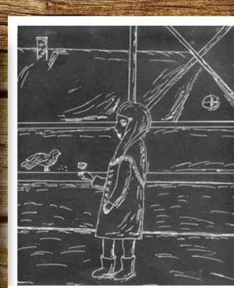
«Хлеб для друга», Рената Романова, 4 кл.