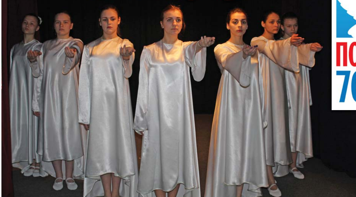
Танцевально-поэтическая композиция «Журавли». Театральная студия «Конфетти». Художественный руководитель - Ю.С.Чистякова

26 апреля в актовом зале института детства открылась выставка художественных работ учеников начальных классов ГБОУ СОШ № 479 «Славянских культур», посвященная 70-летию со Дня Победы в Великой Отечественной войне.