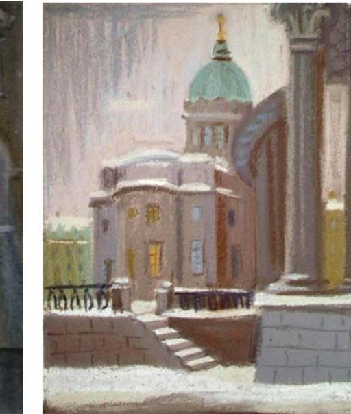
«Казанский собор», бумага, пастель