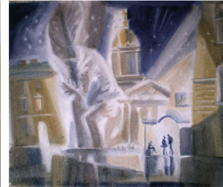
«Перед сессией», бумага, акварель