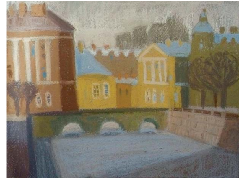
«Ранняя весна», бумага, пастель