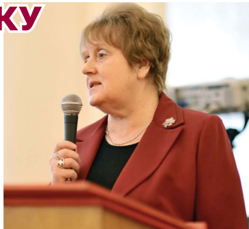
исполнительным директором этого научного направления.