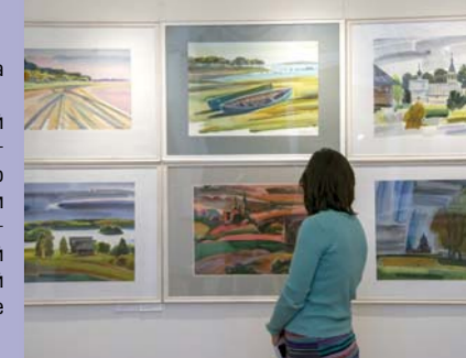
Выставка работ в выставочном зале художественной школы им. М.К. Анкишина в Кронштадте

преподаватели факультета изобразительного искусства герценовского университета.