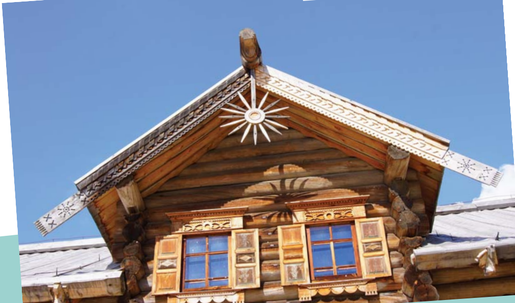
Дом двора А.Ф. Пухова, первая треть XIX века