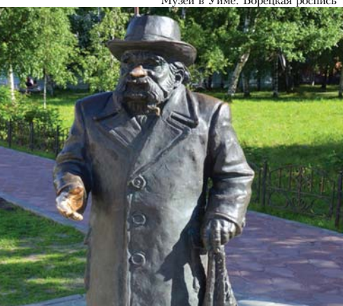
Памятник Степану Писахову в Архангельске