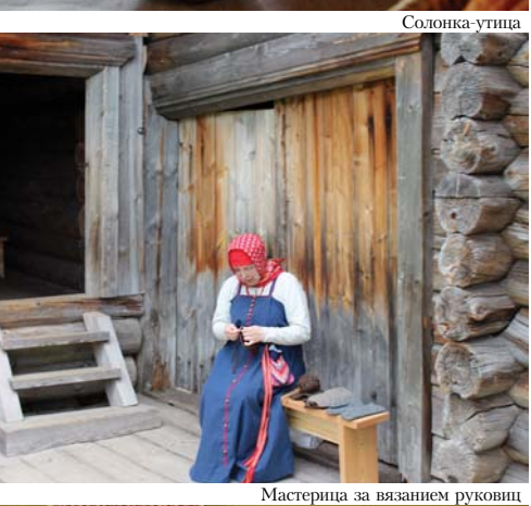
Мастерица за вязанием рукавиц