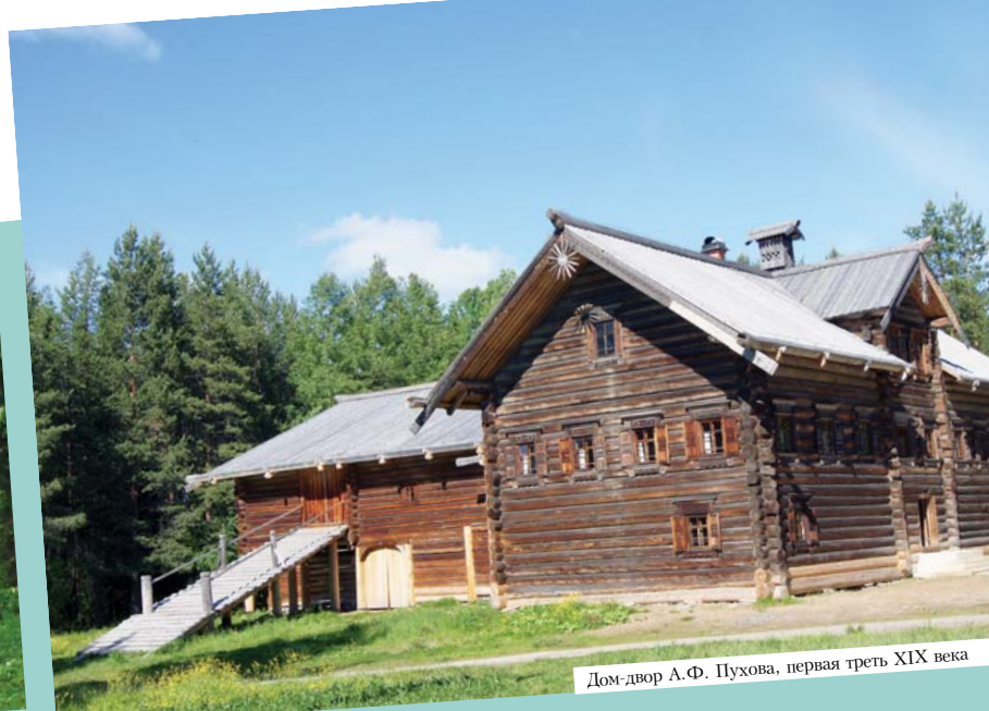
Дом двора А.Ф. Пухова, первая треть XIX века