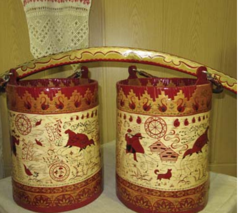
Музей в Уйме. Борейская роспись