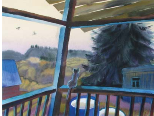
«Вечерние птицы», бумага, акварель, 2008