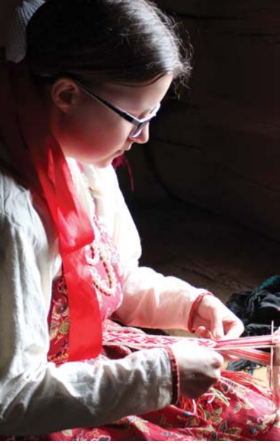
За изготовлением пояса