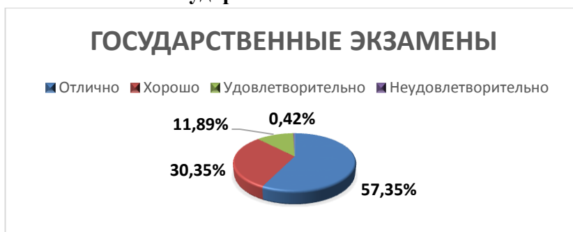
Рисунок 2. Распределение оценок за государственные экзамены.

Образовательные программы высшего образования – программы магистратуры: