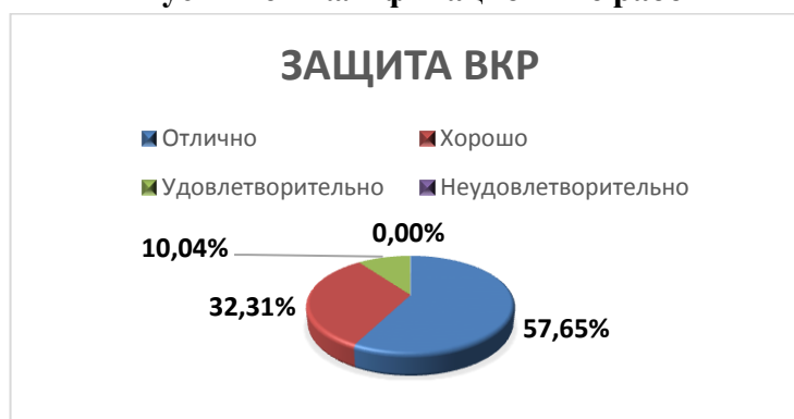
Рисунок 3. Распределение оценок за выпускные квалификационные работы.