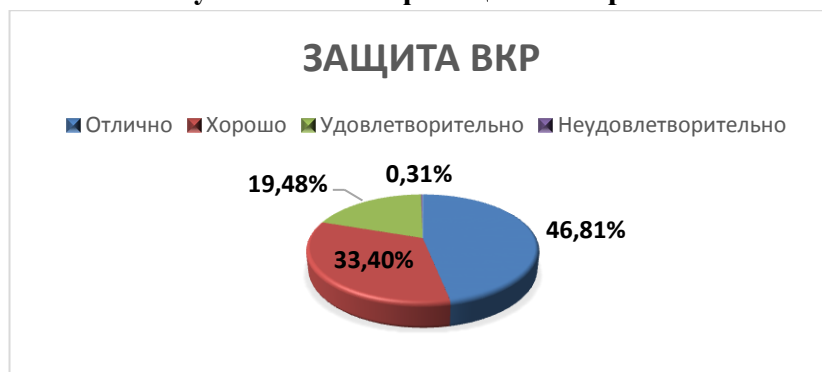
Рисунок 1. Распределение оценок за выпускные квалификационные работы.