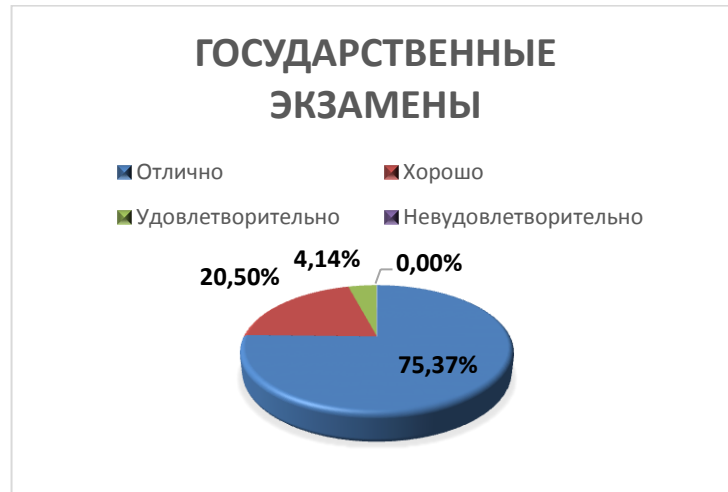
Рисунок 4. Распределение оценок за государственные экзамены.

Образовательные программы высшего образования – программы специалитета: