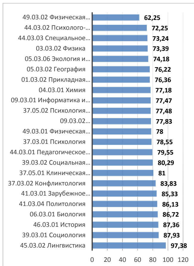
Рисунок 3. Внутриуниверситетский рейтинг направлений подготовки и специальностей по среднему баллу ЕГЭ зачисленных в 2018 г. на места в рамках контрольных цифр приема граждан на обучение за счет бюджетных ассигнований федерального бюджета по общему конкурсу

По результатам приема по программам бакалавриата и специалитета по очной форме обучения средний балл ЕГЭ зачисленных на 1 курс на бюджетные места составил – 76,49 , зачисленных по общему конкурсу – 78,80 , зачисленных по заочной форме обучения составил – 69,46 , зачисленных по общему конкурсу – 69,95 . Внутриуниверситетский рейтинг направлений подготовки и специальностей по среднему баллу ЕГЭ баллу ЕГЭ зачисленных по очной форме обучения по общему конкурсу отражает рисунок.