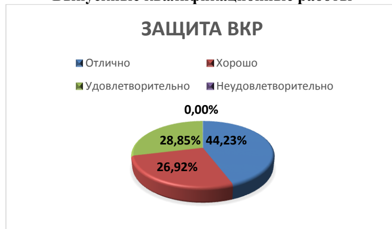
Рисунок 5. Распределение оценок за выпускные квалификационные работы.