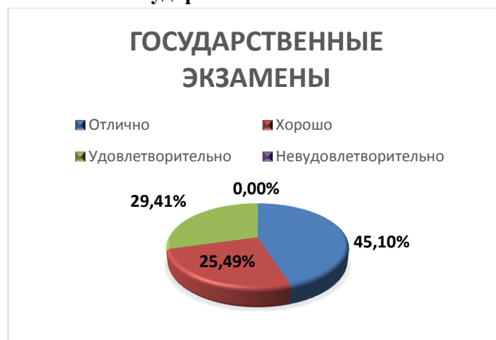
Рисунок 6. Распределение оценок за государственные экзамены.