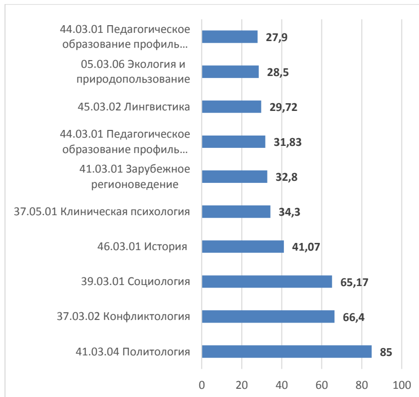
Рисунок 1. ТОП-10 образовательным программам бакалавриата и специалитета по конкурсу заявлений на места в рамках контрольных цифр приема граждан на обучение за счет бюджетных ассигнований федерального бюджета по очной форме обучения в 2018 г., чел./место

Внутриуниверситетский рейтинг (ТОП-5) образовательных программ бакалавриата по сложившемуся конкурсу заявлений на очную форму обучения по договорам об образовании следующий: 44.03.01 Педагогическое образование профиль Обществоведческое образование – 20,20 ; 44.03.02 Психолого-педагогическое образование профиль Психология образования – 18,40 ; 44.03.02 Педагогическое образование профиль Информатика и информационные технологии в образовании – 11,80 ; 44.03.02 Психолого-педагогическое образование профиль Психология и социальная педагогика (Детская психология) – 11,75 ; 41.03.04 Политология профиль Политология – 10,67 .