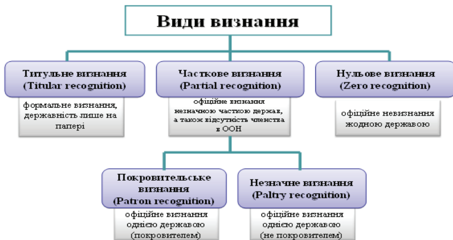
Рис.1 Види міжнародного визнання за Д. Гелденхейсом.

3. Нульове визнання (zero recognition, від англ. zero – нуль), коли держава не визнається жодною іншою державою. На разі такі випадки не зафіксовані.