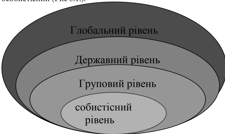
Рис.3.1. Схема чинників, які впливають на формування протестних настроїв

Політична протестна напруженість має у своїй основі дію різних чинників або їх поєднання. Неможливо побудувати жорстку ієрархію факторів політичного протесту для будь-якої країни і ситуації. Кожного разу це буде свій набір. Однак можна виробити концептуальну схему, в якій дослідник буде оцінювати відносну вагу окремого фактора, а також їх взаємозв'язок для своєчасного вжиття заходів, щоб впливати на ситуацію і направити розвиток політичного процесу в конструктивному напрямку. На думку автора, слід систематизувати чинники, що впливають на політичну напруженість. Це можна зробити за допомогою схеми, в якій, на думку автора, слід виділити глобальний рівень, державний, груповий та особистісний (Рис 3.1.).