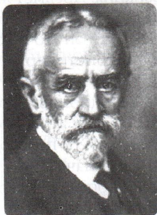
А. Геттнер (1859–1941)

ставление не может отличаться большой глубиной и конструктивностью, но, как мы увидим далее, именно географии суждено стать одним из лидеров в межпредметном осмыслении связей «между силами, телами и явлениями, между мертвой и живой природой, между растительными, животными и минеральными царствами, с одной стороны, и человеком, его бытом и даже духовным миром – с другой».