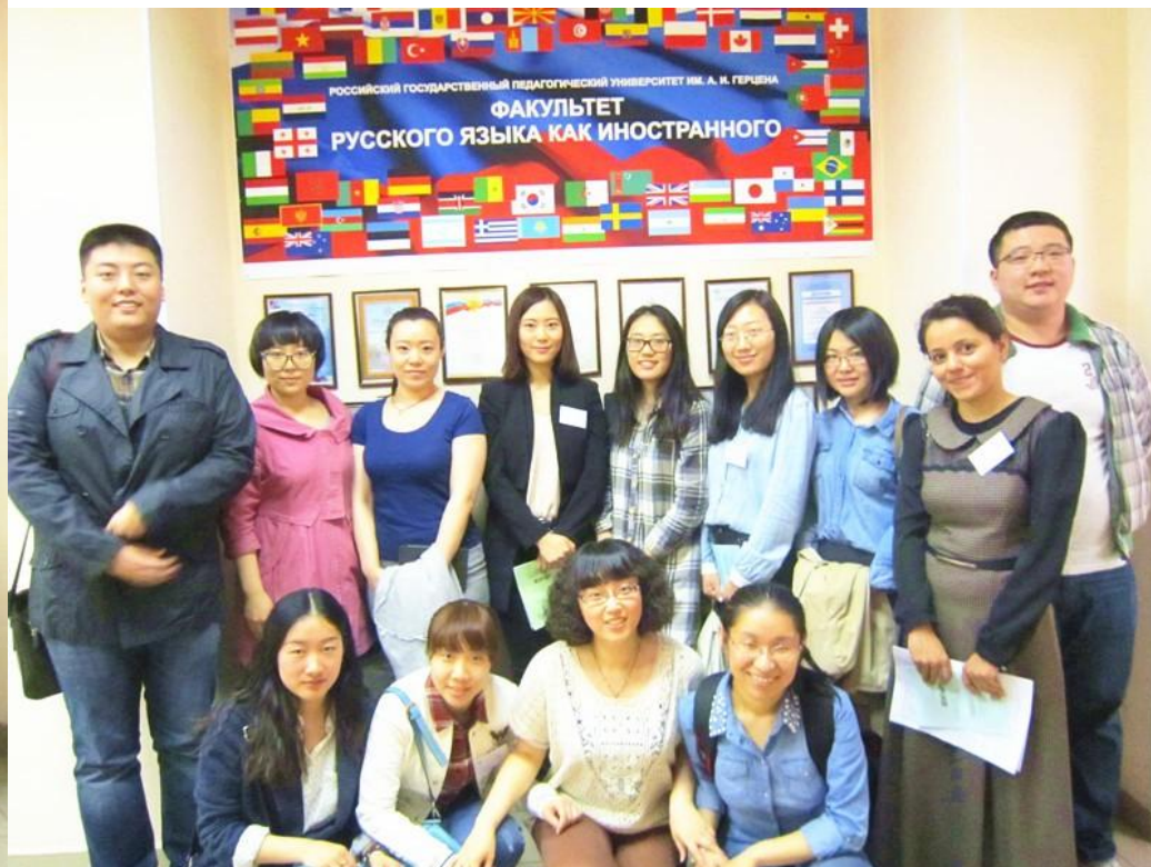
Наша группа участвует в конференции: магистранты 1 курса магистерской программы «Профессиональная коммуникация в международном деловом сотрудничестве»