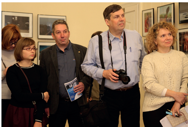
Открытие выставки лучших фотографий фотоконкурса «Геофокус» в Студенческом дворце культуры Герценовского университета