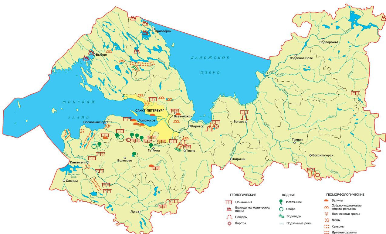
Карта «Геологические памятники Ленинградской области» для Атласа Ленинградской области «Выпускник-2020», М: 1:1000000 (сост. Андреева Т.А.)