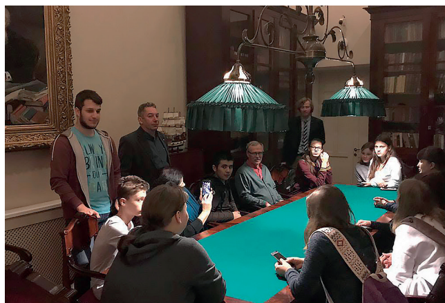
Экскурсия слушателей школы «Планета» (преемника Малого географического факультета) в Штаб-квартиру Русского географического общества