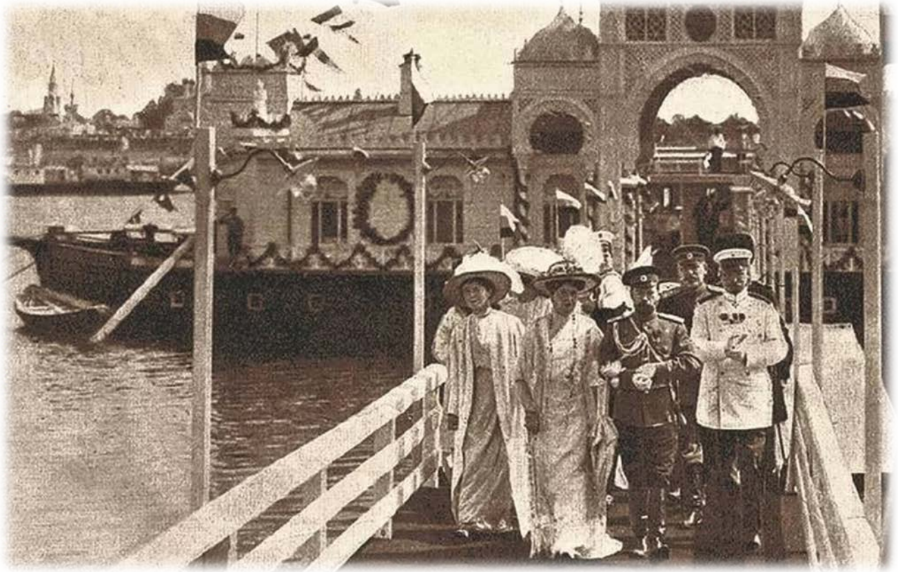
Визит Николая II в Ярославль 21 мая 1913 г.