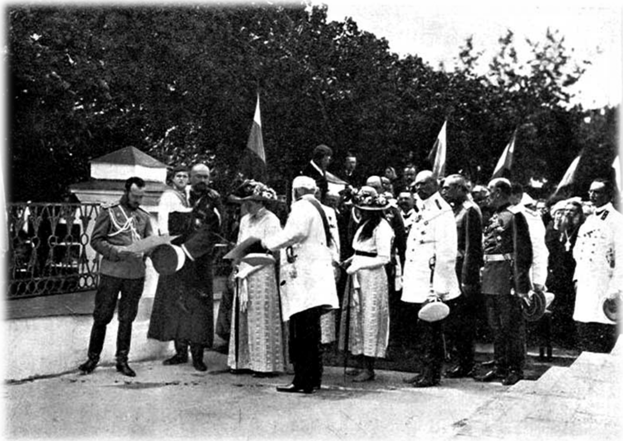
Император Николай II на прогулке по Ярославлю