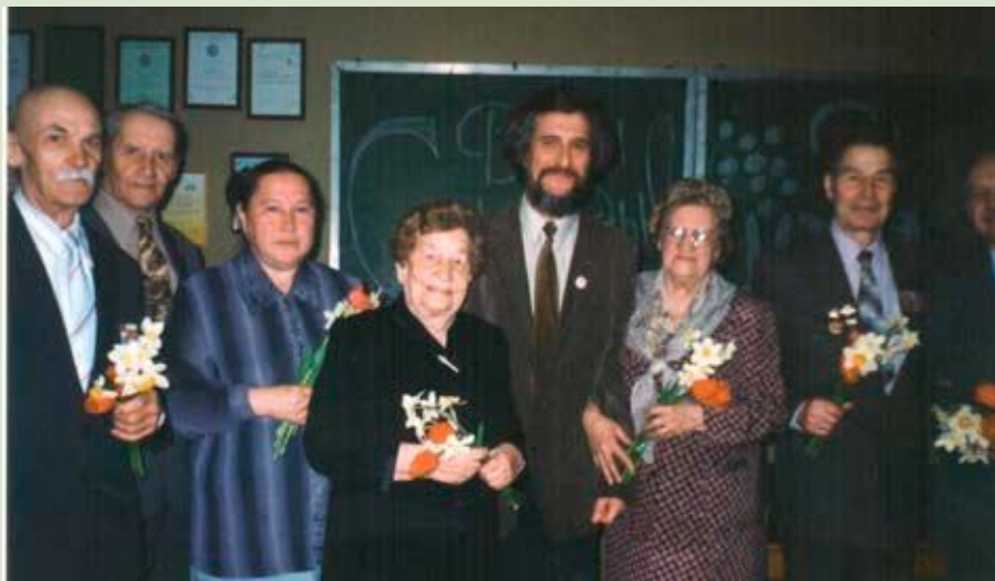
Встреча с ветеранами в 1999 году

На психолого-педагогическом факультете РГПУ им. А.И. Герцена сложилась традиция – преподаватели и студенты ежегодно встречаются на праздниках, посвященных Дню Победы и снятию блокады Ленинграда, где происходит торжественное чествование ветеранов и участников Великой Отечественной войны.