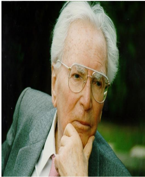
Виктор Франкл (1905 – 1997)

УНИВЕРСАЛЬНОСТЬ СМЫСЛА ЖИЗНИ СОСТОИТ В ВОПЛОЩЕНИИ ВЫСШЕЙ ЧЕЛОВЕЧНОСТИ: ЛЮБВИ, КРАСОТЫ, СОСТРАДАНИЯ, ДОБРА И МУДРОСТИ.