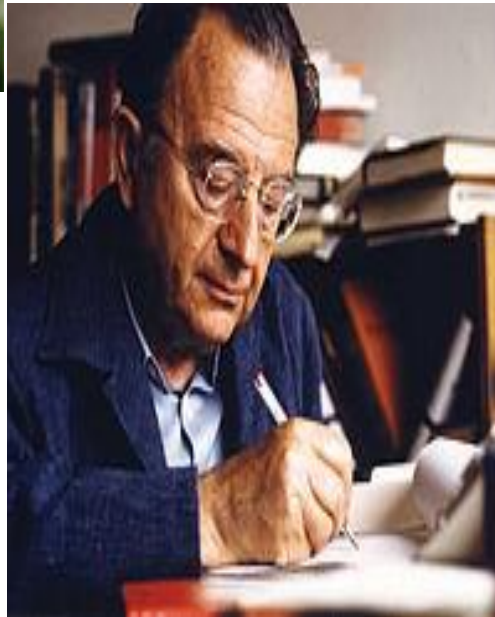
Эрих Фромм (1900 - 1980 )

УНИВЕРСАЛЬНОСТЬ СМЫСЛА ЖИЗНИ СОСТОИТ В ВОПЛОЩЕНИИ ВЫСШЕЙ ЧЕЛОВЕЧНОСТИ: ЛЮБВИ, КРАСОТЫ, СОСТРАДАНИЯ, ДОБРА И МУДРОСТИ.