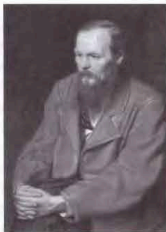
Б. Ф.М. Достоевский