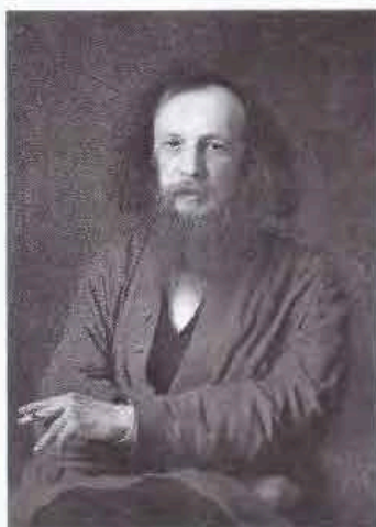
А. Д.И. Менделеев

20. Укажите русского писателя, который жил в XIX веке.