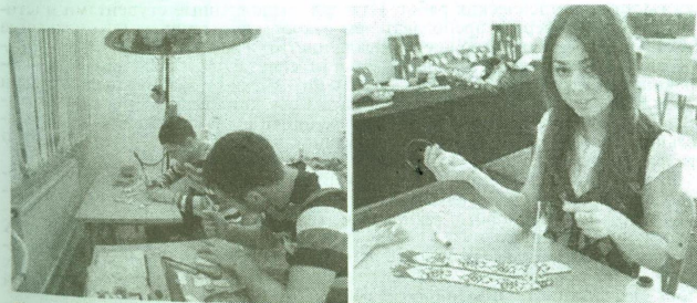
Рис. 6, 7. Студенты института народов Севера в кабинете декоративно-прикладного искусства

Важное направление художественной подготовки – поиск средств современного творчества, адаптирующего художественную традицию к условиям современной коммуникации и при этом не искажающего ее этноэстетические основы. Освоение традиционных средств сочетается с освоением классических основ изобразительной деятельности – рисунок, композиция, работа с объемом, цветом. Этому способствует преподавание ряда культурологических курсов, в частности, курса истории мировой художественной культуры. Эта