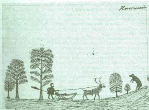
Рис. 4. С. Ноготысий. «Встреча с медведем»