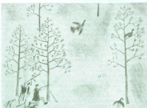
Рис. 1. Иван Абрамов. «Охота на птиц»