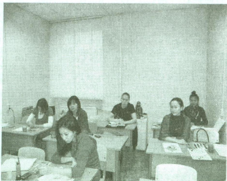
Рис. 8. Студенты работают над эскизами

образовательная практика очень близка той, которая применялась при обучении первых студентов института народов Севера в 1930-х годах XX в. Она прошла испытание временем и доказала свою целесообразность и востребованность.