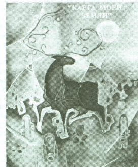
Рис. 9, 10. Работы студентки Е. Зинкиной (батик)