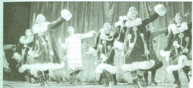
Рис. 11. Фольклорный театр-студия «Северное сияние»

ных этносов. Коллективом неоднократно проводились семинары для работников культуры и образования, руководителей и участников творческих коллективов северных округов «Театрально-зрелищные формы фольклора» в Сургуте, Ханты-Мансийске, Анадыре, Салехарде. С 1995 г. коллектив успешно гастролирует по многим городам России и за рубежом. Преподаватели, аспиранты, сотрудники и студенты исполняют танцевальные, вокальные, инструментальные, пластические, игровые миниатюры, элементы ритуалов и обрядов, представляющие фольклор коренных народов Севера, Сибири и Дальнего Востока России – чукчей, эскимосов, коряков, ительменов, якутов, эвенков, нивхов, нанайцев, хантов, манси, саамов и др. Ансамбль знакомит зрителя с традиционными музыкальными инструментами и костюмами, широко представляет аутентичный фольклор коренных народов Севера, адаптируя его к современной сцене, делая доступным для восприятия. Большое значение для развития толерантности имеют специальные лекции-концерты для детской и молодёжной аудитории, знакомящие зрителей с особенностями фольклора и традиционной культуры коренных народов Севера. Театр-студия проводит мастер-классы, уроки дружбы в образовательных учреждениях и музеях, участвует в общегородских, всероссийских и международных фестивалях.