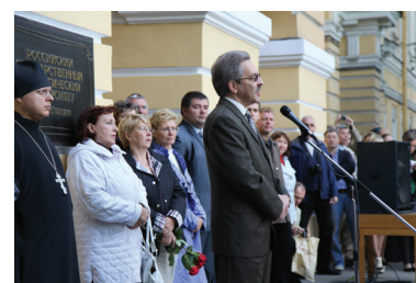
Выступление уполномоченного по правам человека в Санкт-Петербурге А.В. Шишлова