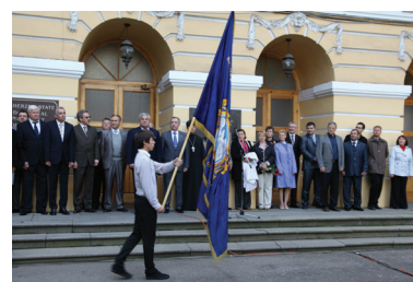
Флаг Герценовского университета