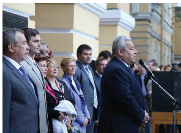
Вице-губернатор Санкт-Петербурга В.Н. Кичеджи приветствует герценовцев