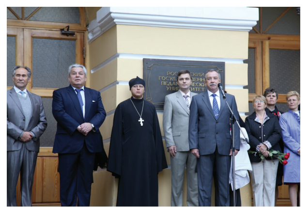
Выступление ректора Герценовского университета В.П. Соломина