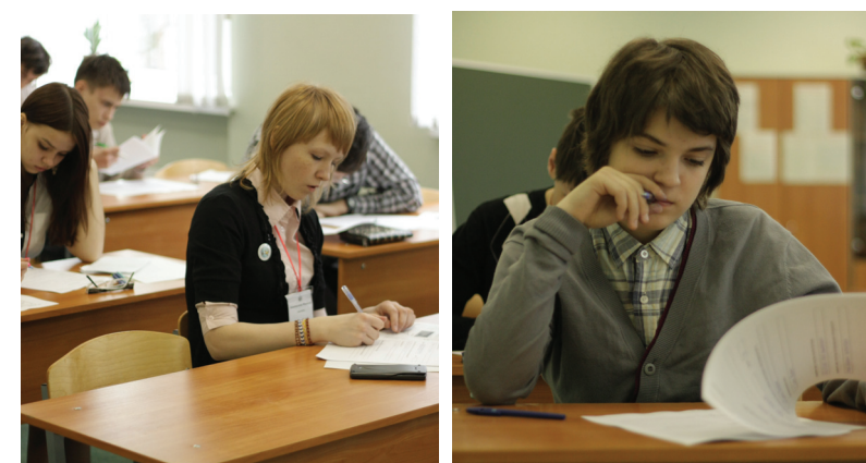
Материал подготовлен отделом по работе с абитуриентами