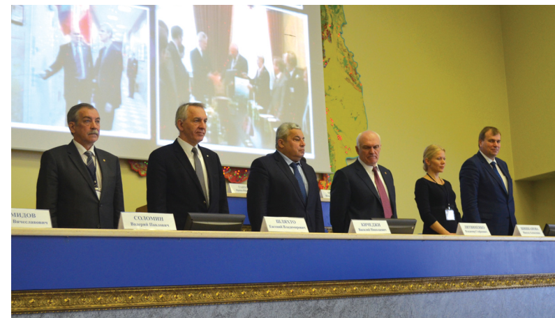
Открытие пленарного заседания

Молодежный дискуссионный клуб «Качество образования: вуз-студент-работодатель-общество», прошедший в Дискуссионном зале Герценовского университета, собрал более 100 студентов петербургских вузов, преподавателей, активистов молодежных объединений и представителей