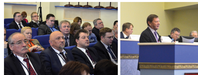
Делегация РГПУ им. А.И. Герцена