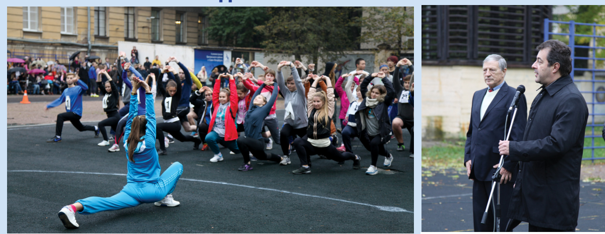
Зарядка со звездой

10 октября на стадионе РГПУ им. А.И. Герцена прошел двадцатый юбилейный спортивный праздник «День первокурсника». Спортосве не ограничилось: грандиозный гала-концерт «Первокурсник» в Колонном зале вызвал, по словам организаторов, небывалый интерес среди студентов.