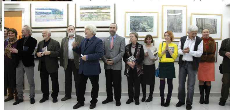
Сотрудники кафедры рисунка на открытии выставки