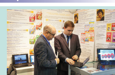
Защита проектов перед жюри