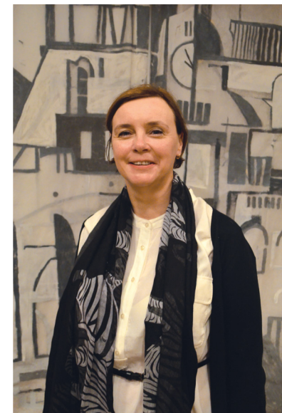
Заслуженная артистка России М.К. Лаврова