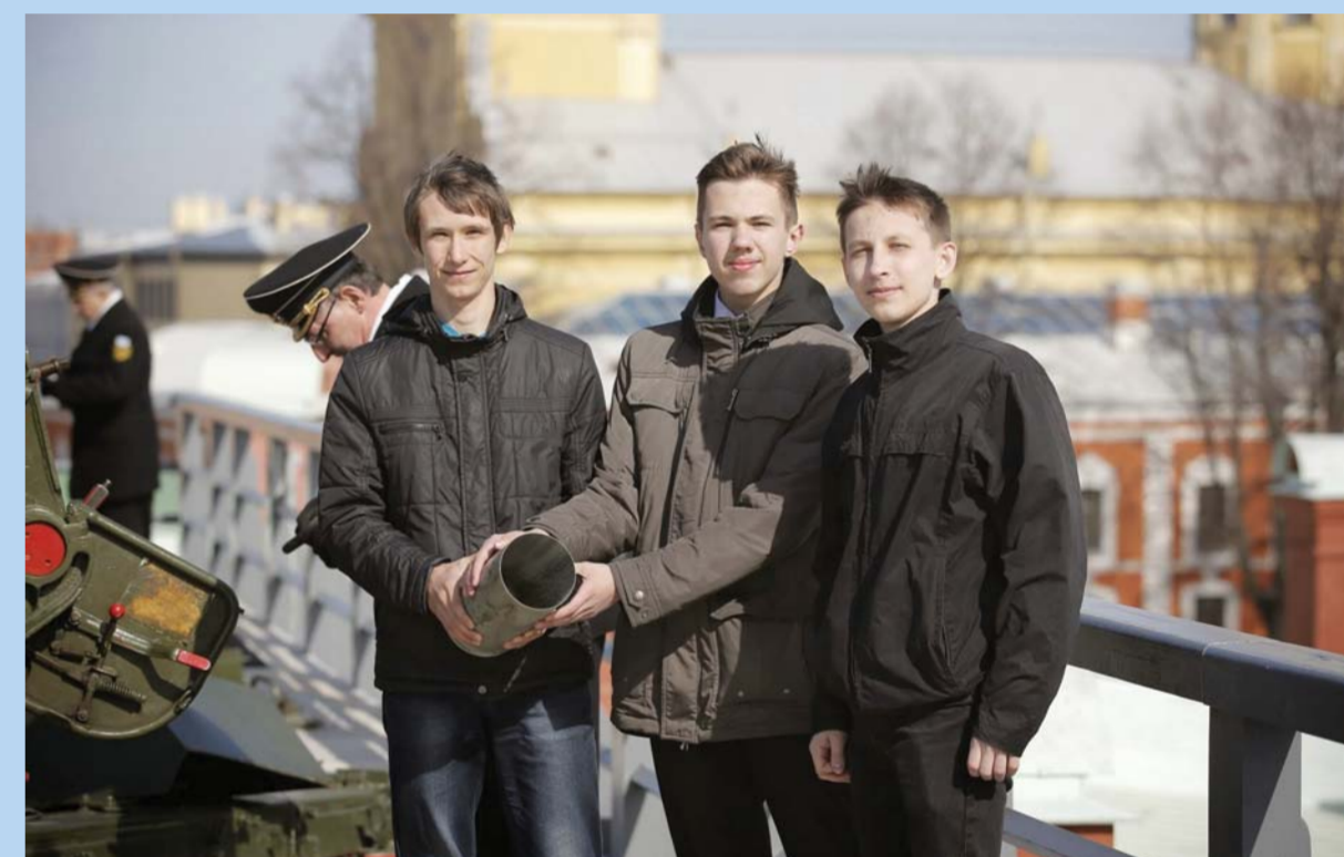
Победители олимпиады — на Нарышкином бастионе Петропавловской крепости