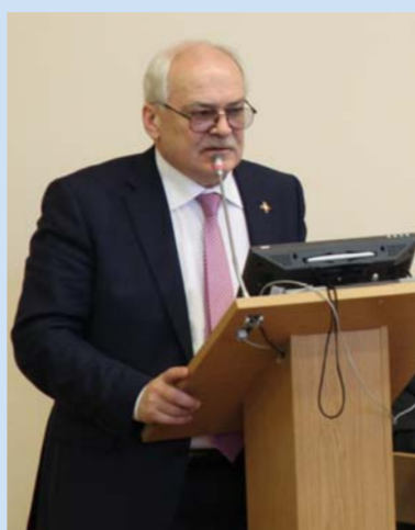
Выступление Н.В. Бузова