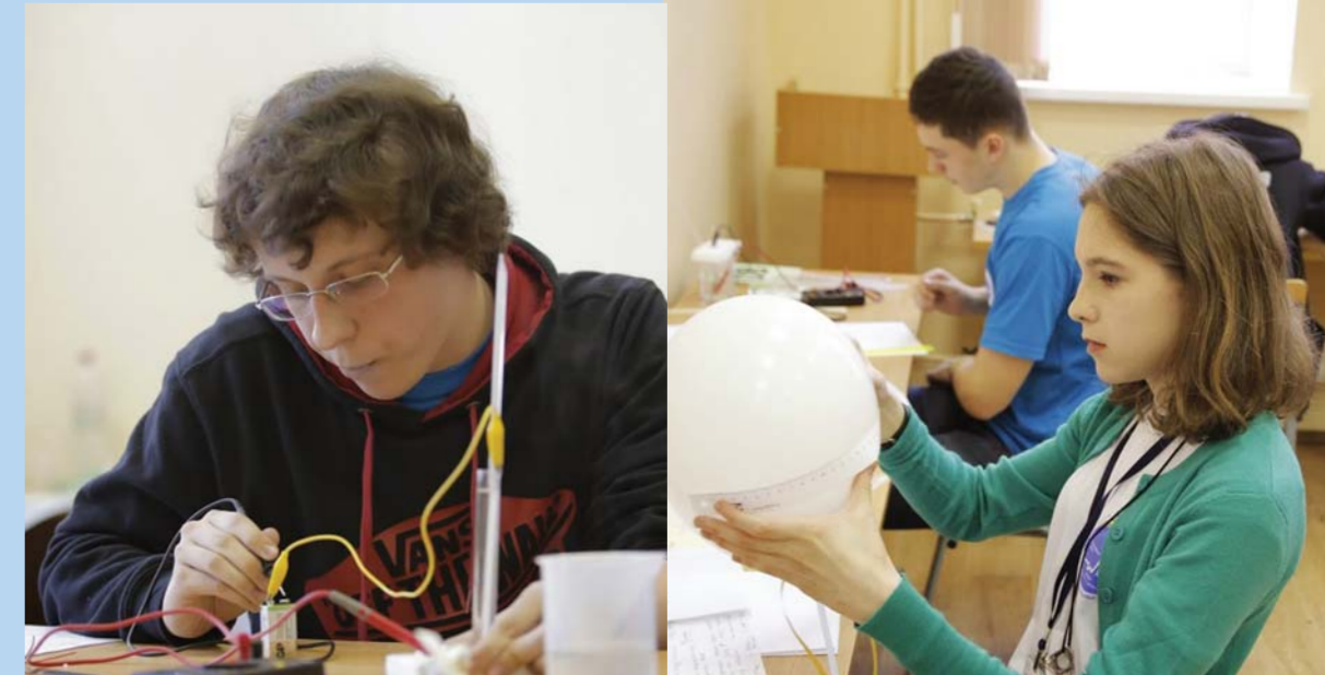
Участники олимпиады выполняют задания экспериментального тура