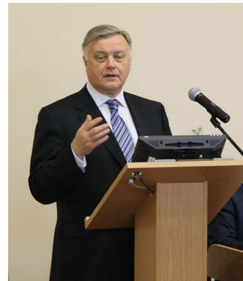
Выступление президента ОАО «Российские железные дороги», доктора политических наук В.И. Якунина

ПРЕЗИДЕНТ ОАО «РЖД» ВЛАДИМИР ЯКУНИН ПРОВЕЛ ОТКРЫТУЮ ЛЕКЦИЮ ДЛЯ ГЕРЦЕНОВЦЕВ