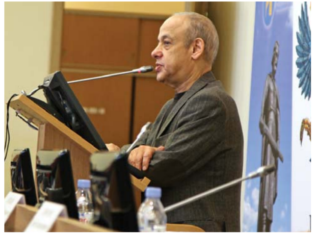
Выступление директора Федерального института развития образования, академика Российской академии образования А.Г. Асмолова

Сегодня происходит пересосложение места человека в этом мире. Можно сказать, что возникает угроза антропологической катастрофы. И именно образование должно помочь человеку обрести себя в современном мире. И это не пустая метафизическая тема. Напротив, это понятие имеет прямое отношение к современному образованию.