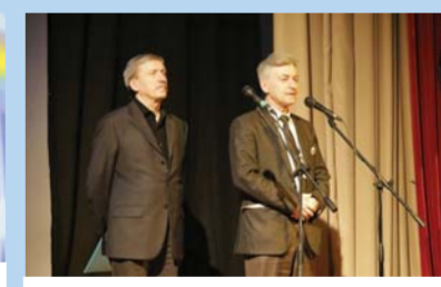
На торжественной церемонии закрытия