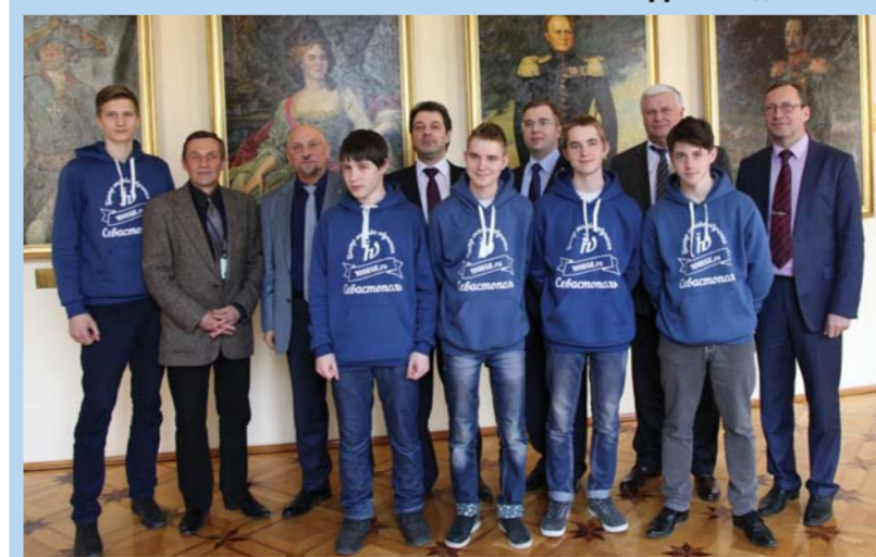
Встреча с делегацией Севастополя