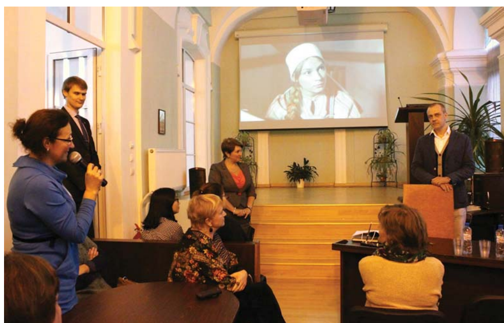
Обсуждение фильма в Фундаментальной библиотеке