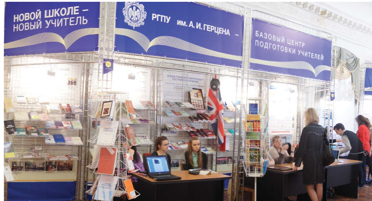
Раздел «РГПУ им. А.И. Герцена – базовый центр педагогической подготовки»

управления, информационной безопасности, электронного документооборота, свободного программного обеспечения, средств и систем автоматизации. • «Герценовский университет – новая школа». Представлены учебно-методические комплексы, учебники, программы, методические учебные пособия для общеобразовательной школы и дошкольных образовательных учреждений, коррекционных образовательных учреждений, учреждений дополнительного образования. • «Художественно-творческие работы». Представлены авторские произведения изобразительного, декоративно-прикладного, музыкального искусства, художественные литературные произведения. • «Научные исследования молодых ученых». Представлены результаты научных исследований молодежи, обучающейся в университете: образцы, макеты, модели, электронные ресурсы, экспозиция научных разработок бакалавров, магистрантов, аспирантов, в том числе выполненных в рамках проекта «Молодежная исследовательская команда». В этом году было представлено 498 экспонатов, созданных за период с мая 2011 по апрель 2012 года. В рамках выставки преподавателями, аспирантами и студентами были проведены 22 презентации проектов. Состоялся традиционный конкурс научных, научно-технических, научно-методических и инновационных разработок по девяти номинациям. На него было