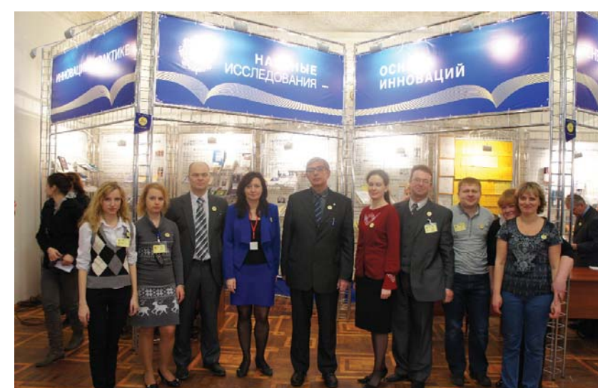
Организаторы выставки – управление научных исследований