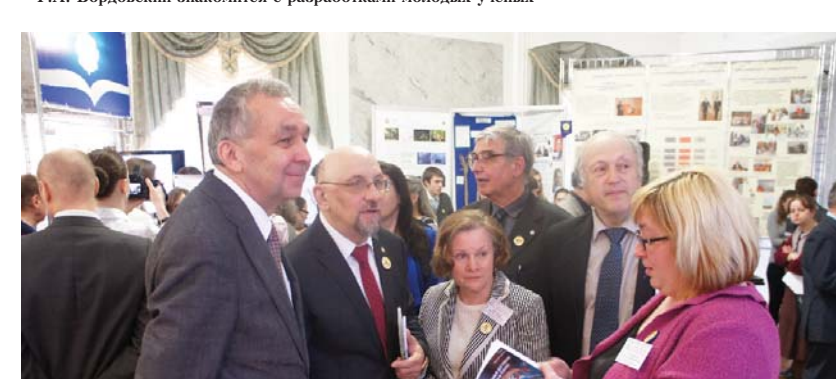
Раздел «Герценовский университет – новая школа», номинация «Учебно-методический комплекс, учебник, разработка для системы общего образования»