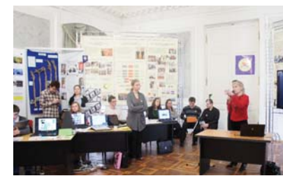
Презентации разработок в рамках деловой программы выставки