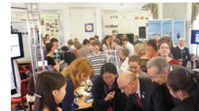
Раздел «Научные исследования молодых ученых, номинация «Научно-инновационный результат исследований обучающейся молодежи»