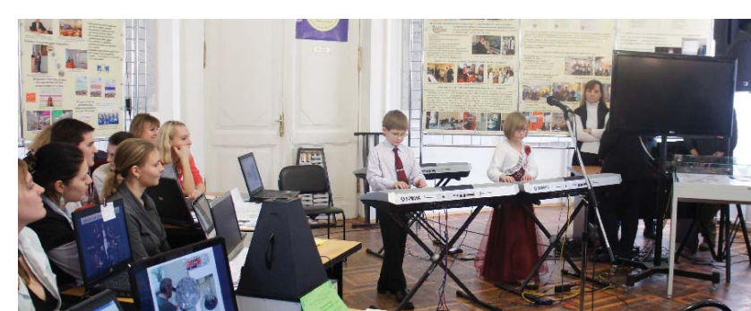
Концерт электронной музыки в рамках открытия выставки