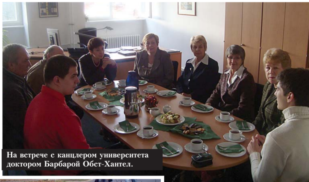
На встрече с канцлером университета доктором Барбарой Обст-Хантел.

направленность, решают задачи, важные для развития вузовской среды, «расширяют» проблемы, возникающие в образовательной практике.