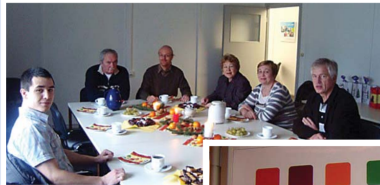
В преддверии Рождества... Обсуждение планов сотрудничества с аудиовизуальным центром Потсдама на следующий год.

студенты и магистранты факультета продемонстрировали немецким коллегам свои электронные проекты, разработанные в рамках дипломного проектирования и выполнения магистерских диссертаций. В результате этих обсуждений договорились о выступлении студентов факультета с докладами на конференции eLEARNING-UP, проводимой в университете Потсдама.