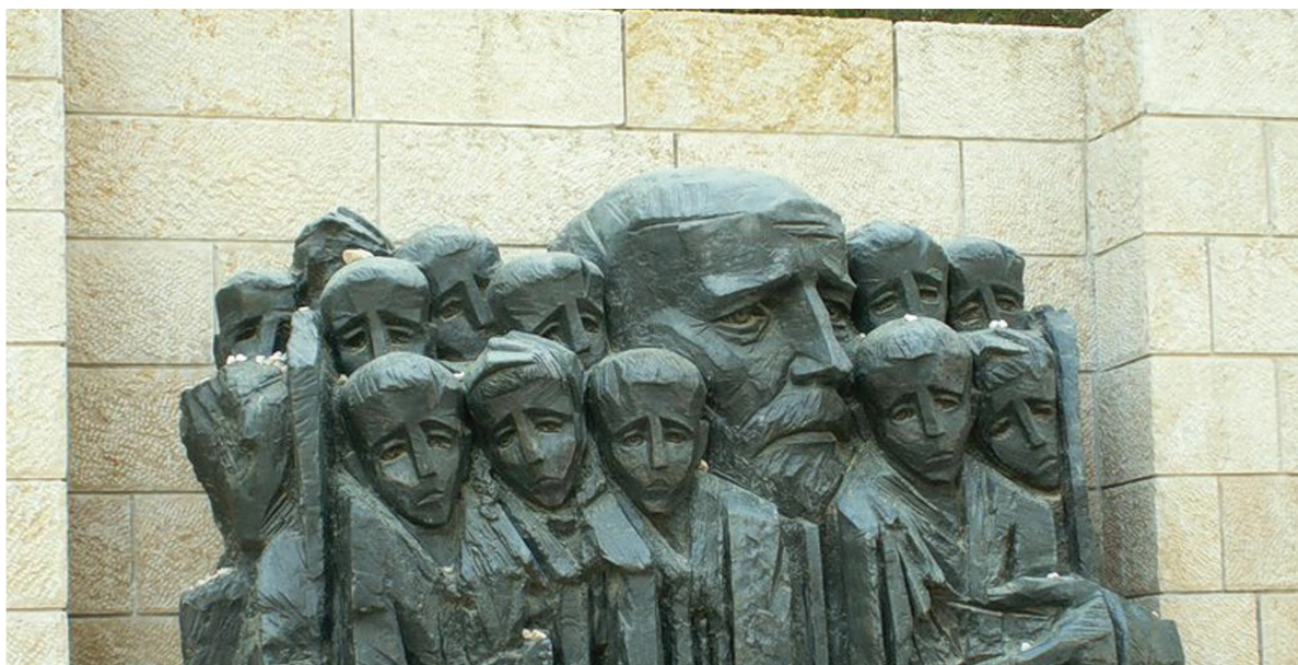
Памятник «Я. Корчак с детьми», Б.Сакциер, Иерусалим

7 ноября в рамках программы конференций «Дни Януша Корчака в Санкт-