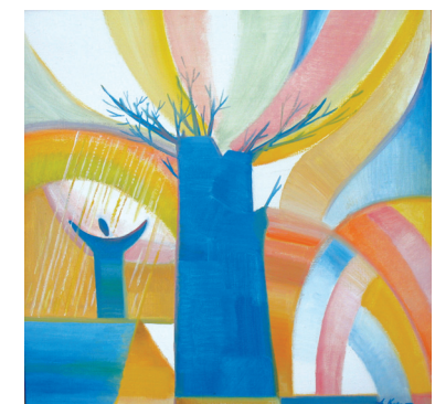
«Весна», холст, масло 2011