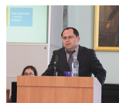
Генеральный консул Государства Израиль в Санкт-Петербурге Э. Шапира