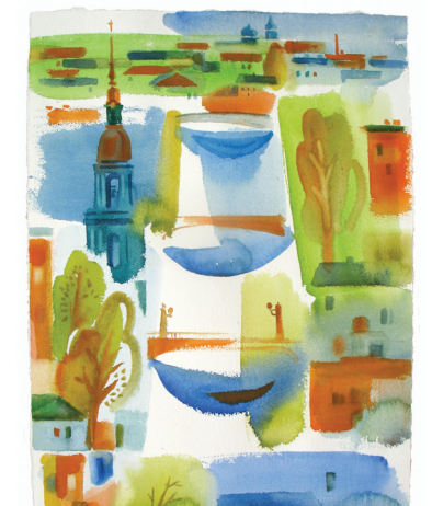
«Крюков канал», бумага, акварель 2011

профессионализм и понимание тонкостей полиграфического производства, усвоенные еще в стенах Академии художеств, неизменно гарантируют высокое качество создаваемых обложкам и постраничным элементам книжного убранства. Как несомненную удачу на издательском поприще можно оценить выход в свет в его оформлении очерков «Художники под знаком пеликана» (2012). Работа была выполнена в кратчайший срок, абсолютно бескорыстно и с искренним желанием добиться наилучшего результата. Великолепной интарсией воспринимаются в альбоме шесть акварельных листов, посвященных архитектурному ансамблю университета имени А.И. Герцена. Они пронизаны интонациями искреннего почтения петербургской исторической среды. И это правомерно, поскольку А. Корольчук уже четверть века, работая на кафедре рисунка, сроднился со стенами альма-матер и свою любовь к красоте, к искусству, к факультету щедро передает ученикам. Н.Н. ГРОМОВ, профессор кафедры рисунка