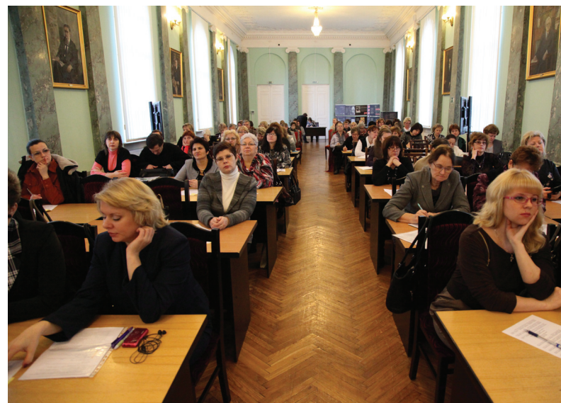
Гости и участники конференции

обучения отдельным учебным предметам на примере истории и биологии, а также деятельности современного учителя. Вызвал интерес и доклад о построении современных школьных учебников, новых педагогических стратегиях, ориентированных на эмоциональную насыщенность образовательного процесса, переживания, яркую событийность, решение ситуационных и личностных задач.