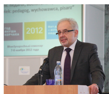
Генеральный консул Республики Польша в Санкт-Петербурге П. Марциняк