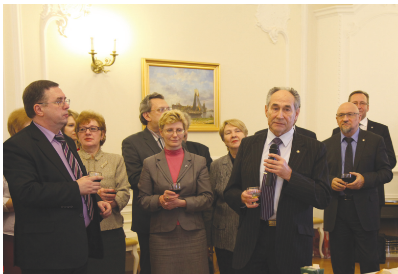
Поздравление президента Герценовского университета Г.А. Бордовского

«Педагогические вести» с достоинством миновали 85-летний рубеж, но работа редакции не останавливается. И это для нас самый настоящий повод для праздника!