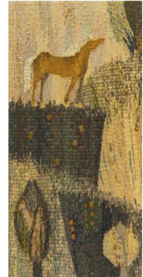
Наталья Бушмина, «Копия». 2013. РГПУ им. А.И. Герцена