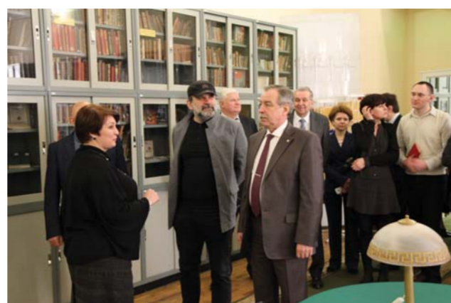
В Фундаментальной библиотеке Герценовского университета