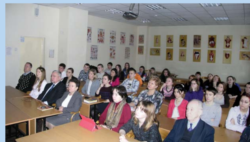
Участники вебинара – преподаватели и студенты факультета безопасности жизнедеятельности

Необходимость организации и проведения цикла вебинаров продиктована тем, что модернизация российского образования предполагает, в первую очередь, значительное обновление содержания общего образования, приведение его в соответствие с требованиями времени и задачами развития страны. За годы существования учебного предмета «Основы безопасности жизнедеятельности» (ОБЖ для школ) и дисциплины «Безопасность жизнедеятельности» (БЖД для средних профессиональных и высших учебных заведений)