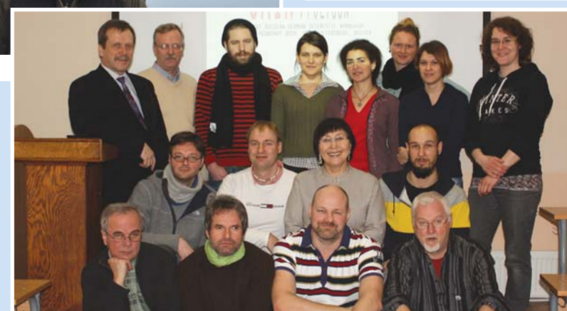
Участники совещания «Полигон 2014»

логии. Широкий спектр отраслевых специалистов позволил придать успешность и высокое качество выполненным программам проекта.