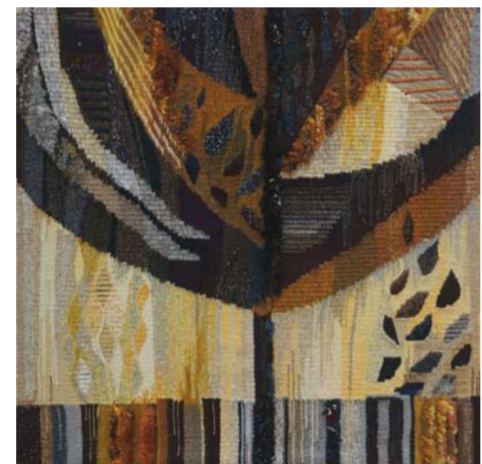
Анастасия Щелконова, «Дерево». 2009. РГПУ им. А.И. Герцена