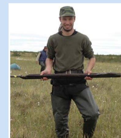
Полевые работы в тундре. Якутия