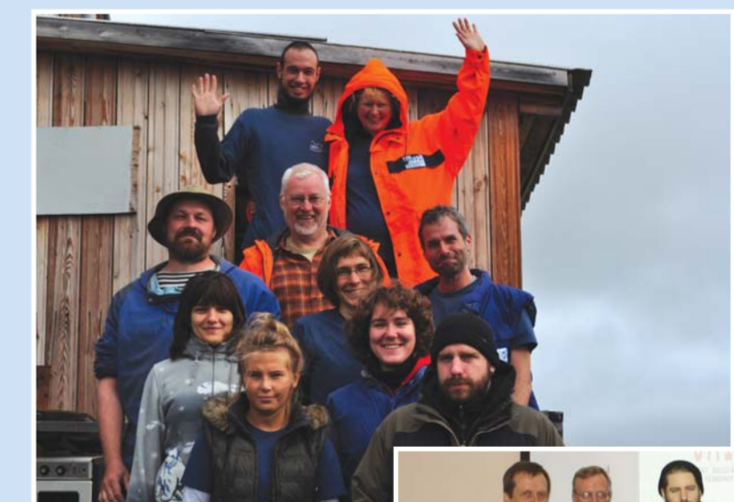
Экспедиционный отряд в дельте реки Индигирка

В ходе совещания и в многочисленных отчетах по результатам работы эксперты отмечали комплексный характер исследований полигональных ландшафтов не имеет аналогов среди подобных исследований. Палеогеографические исследования подтвердили, что Арктика быстро реагирует на изменение климата Земли (явление «арктического преувеличения»). В процессе исследования Арктической Сибири был получен огромный палеогеографический материал, который послужил основанием для оценки современного состояния, прогнозирования развития, а также биомониторинга экологических условий полигональных тундровых экосистем. Полученные результаты и выводы исследований были опубликованы в трех монографиях и в 31 статье в российских и зарубежных журналах.