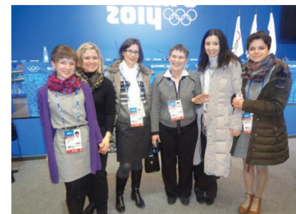
Делегация Высшей школы перевода