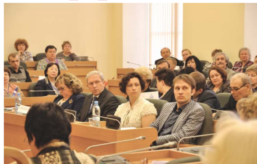
Дискуссионная площадка «Самореализация студента в условиях множественных контекстов образования»