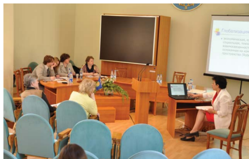
Заседание ректоров вузов-участников сетевого объединения