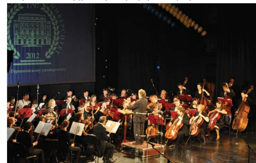
Герценовцев на сцене «Мюзик-Холла» приветствует оркестр «Классика» под управлением заслуженного артиста РФ, профессора Герценовского университета А.Я. Канторова