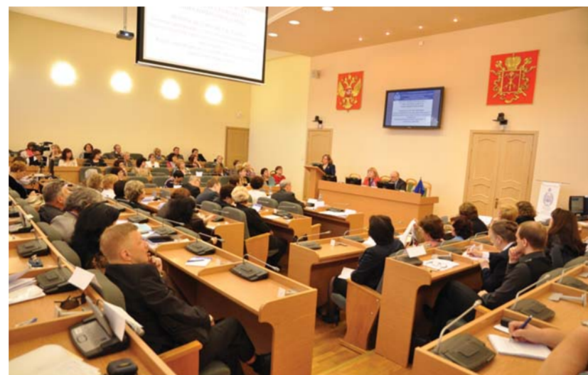
Круглый стол «Социальная роль и компетентности современного учителя: ответственность, ожидание и реальность».

«На II Всероссийской педагогической ассамблее действительно очень широко представлено педагогическое сообщество России. В работе дискуссионных площадок ассамблеи принимали участие не только преподаватели высших учебных