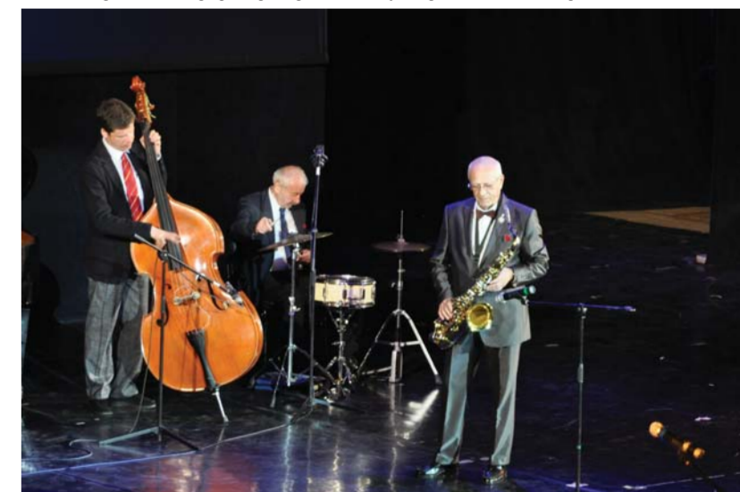
На сцене – народный артист России, профессор Герценовского университета Давид Голощекин и его ансамбль