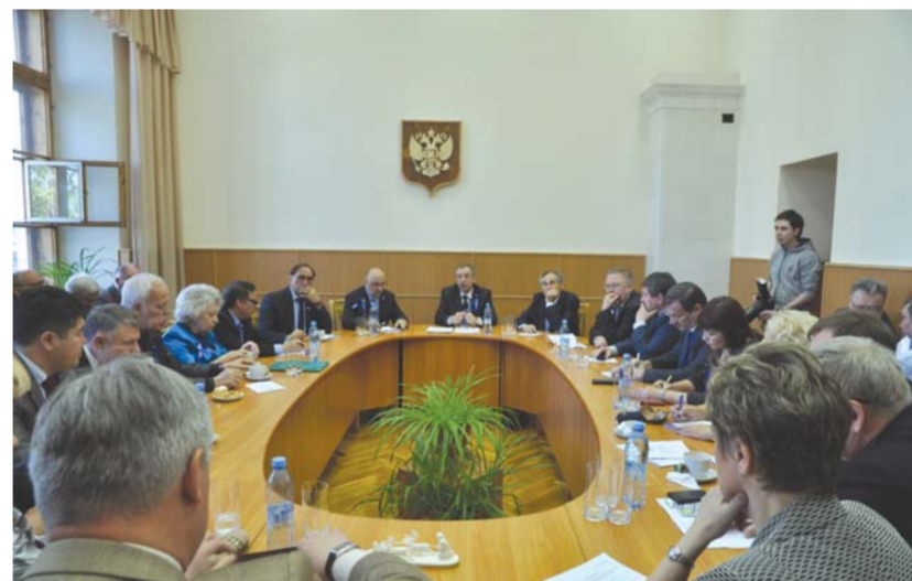
Заседание ректоров вузов-участников сетевого объединения