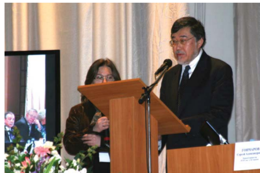
Выступление президента Международной ассоциации школ права (IALS) на заключительном пленарном заседании