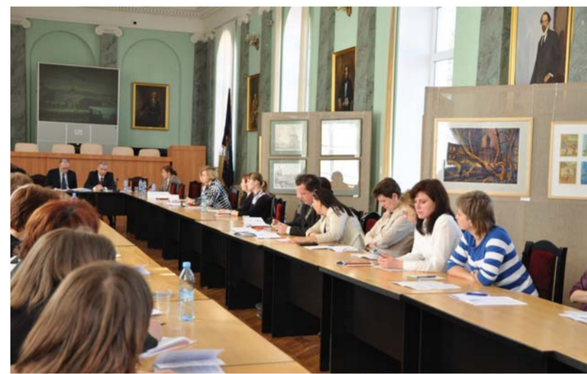
Дискуссионная площадка «Какое образование становится фактором конкурентных преимуществ»

15 мая в зале «Мюзик-Холла» в рамках II Педагогической ассамблеи состоялся концерт, посвященный 215-летию Герценовского университета. В нем принимали участие профессора вуза-юбилея, артисты с миро-