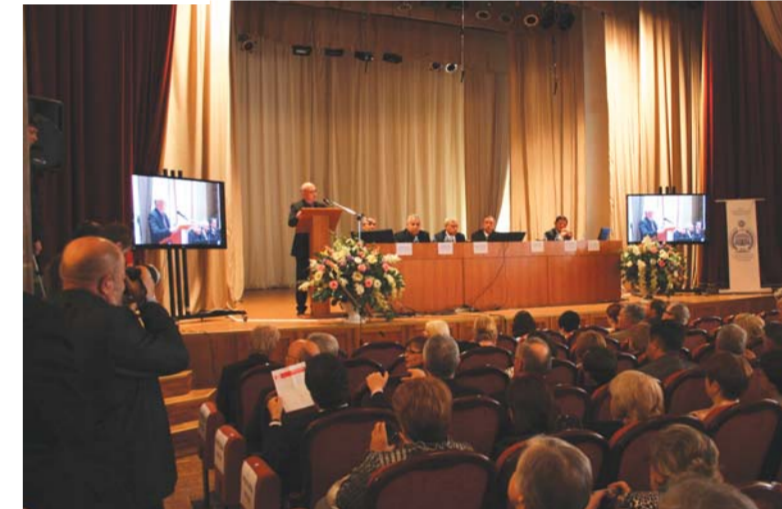
Приветствие заместителя министра образования и науки РФ М.В. Дулинова