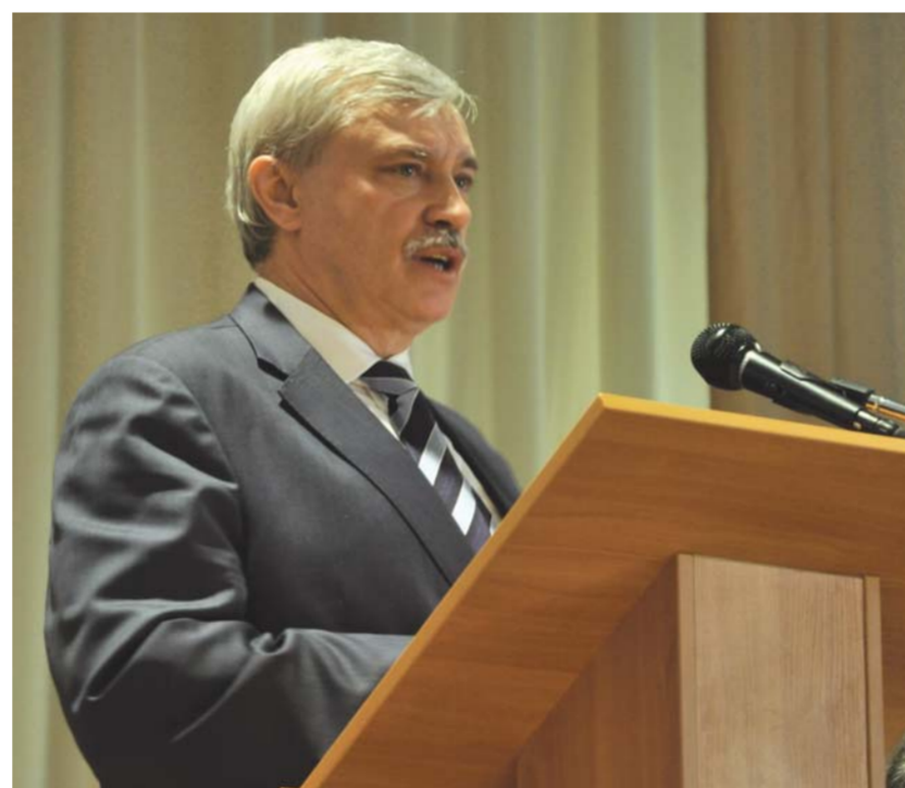
Приветствие губернатора Санкт-Петербурга Г.С. Полтавченко

«Хочу поприветствовать всех участников ассамблеи! Зная о высоких результатах данного образовательного учреждения, я вспомнила слова А.И. Герцена, которые он написал своему сыну: «Идеи – в жизнь, идеи – на службу человечеству – на самый трудный путь». Эти слова можно отнести к выпускникам вузов и их наставникам».