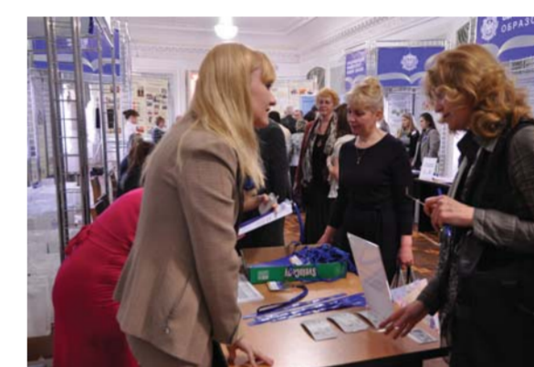
Регистрация участников II Всероссийской педагогической ассамблеи

Итак, первый день работы II Всероссийской педагогической ассамблеи позади. Впереди – день второй – дискуссионные площадки и круглые столы, заседание Наблюдательного совета Герценовского университета, заключительное пленарное заседание, а также