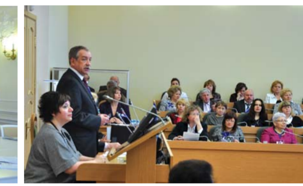
Дискуссионная площадка «Образовательные стандарты и развитие личности: совпадение векторов или параллельное существование»

праздничный концерт в «Мюзик-Холле», посвященный юбилею. Всероссийская педагогическая ассамблея подтвердила статус главного события года в сфере российского образования и педагогики. Об этом свидетельствует внимание СМИ. Сюжеты о педагогической ассамблее и 215-летию РГПУ им. А.И. Герцена прошли в эфире телеканалов «Россия-1» («Вести-Санкт-Петербург»), «СТО-ТВ» и «Санкт-Петербург».