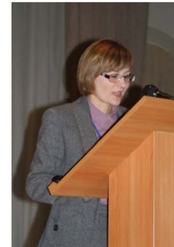
Выступление члена Совета Федерации Федерального Собрания РФ Л.Н. Боковой