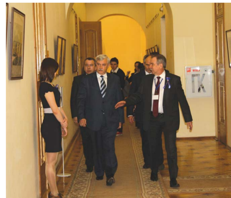
Встреча губернатора Санкт-Петербурга Г.С. Полтавченко