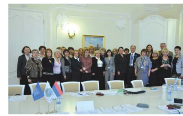
Гости и участники круглого стола «Современное образование – путь к идеалам ЮНЕСКО»