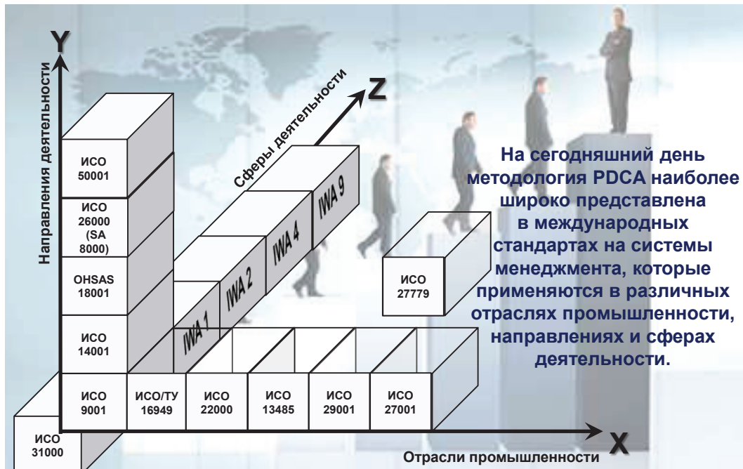
Рис. 4. Трехмерная модель эволюции системного подхода на основе международных стандартов

Модель управления, реализованная в этих стандартах, настолько универсальна, что может применяться не только на микроуровне (уровне предприятий), но и на более высоких уровнях, а именно на уровне региона и страны в целом (рис. 5).