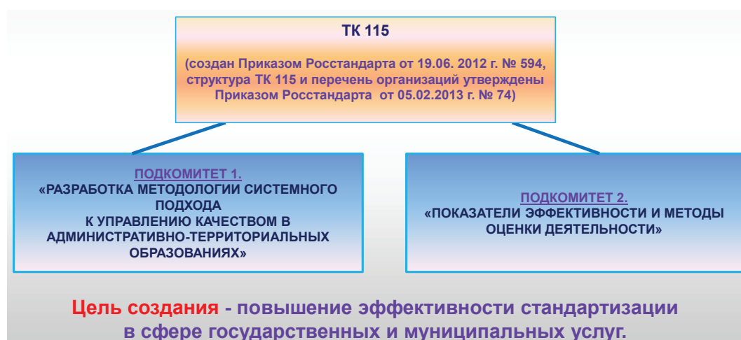
Рис. 9. Структура ТК 115 «Устойчивое развитие административно-территориальных образований»

тывающим реальные потребности населения и позволяющим в целом улучшать качество жизни населения, в начале 2012 г. был образован новый технический комитет ИСО/ТК 268 «Устойчивое развитие в сообществах». Россию в нем представляют эксперты Тест-С.-Петербург (рис. 8).