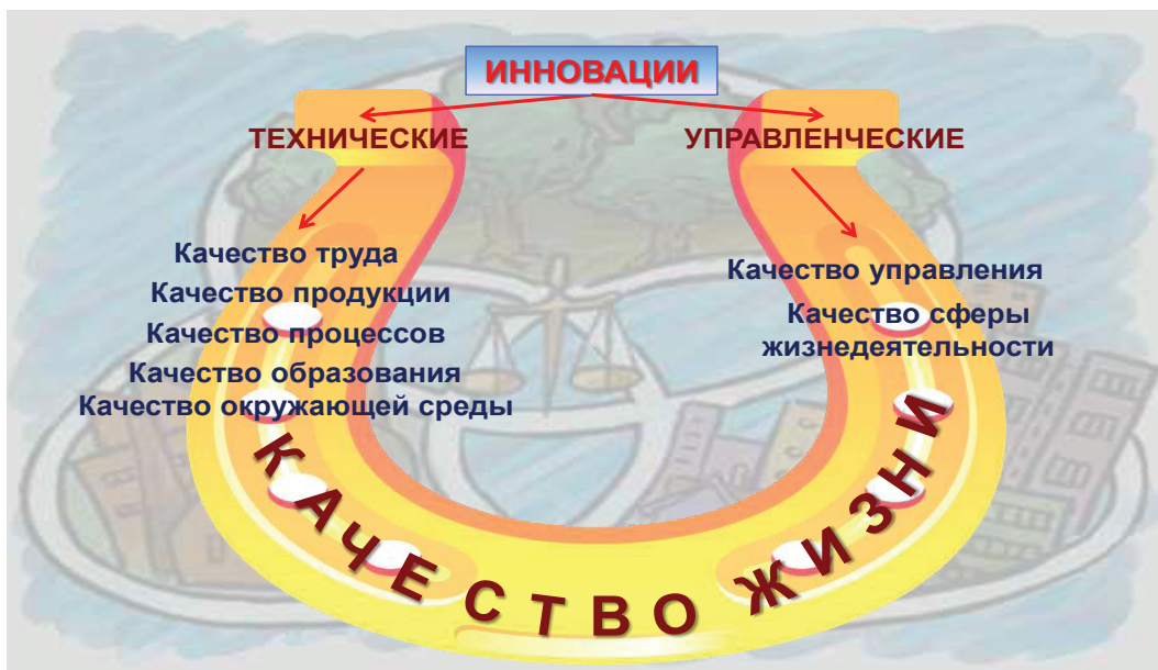
Рис. 2. Влияние инноваций на качество жизни