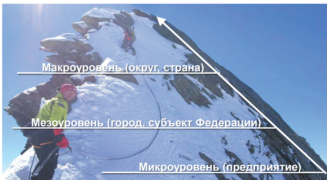
Рис. 5 - Многоуровневая система менеджмента

Создание данной системы на основе методологии PDCA и принципов всеобщего управления качеством (TQM) позволит повысить оперативность управления, будет способствовать улучшению взаимосвязей, даст возможность организовать систематический