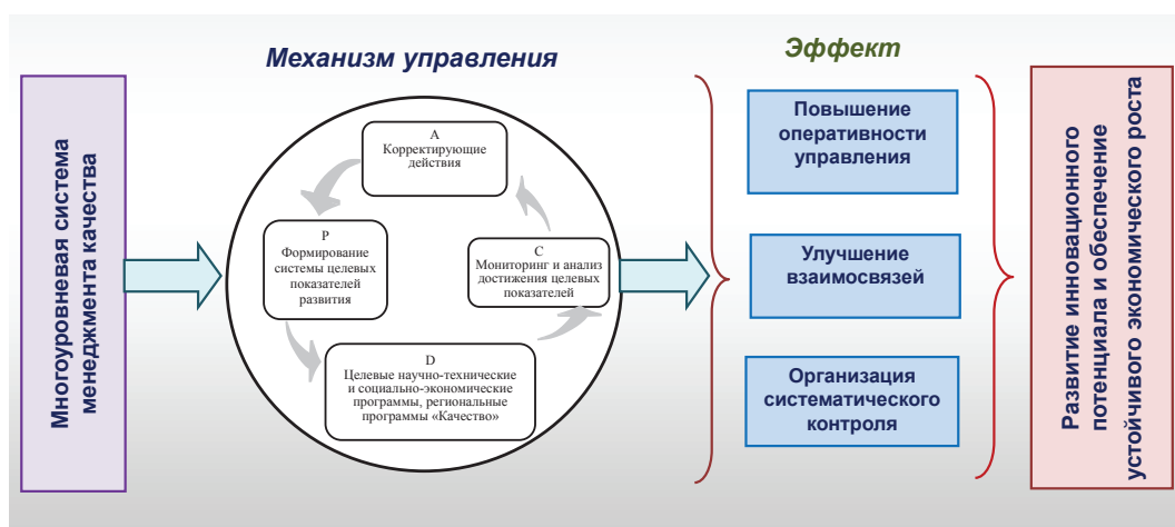
Рис. 6. Эффект от применения системного подхода на различных уровнях управления

Для того, чтобы сделать государственное (муниципальное) управление более гибким, устойчивым и эффективным, а также учи-