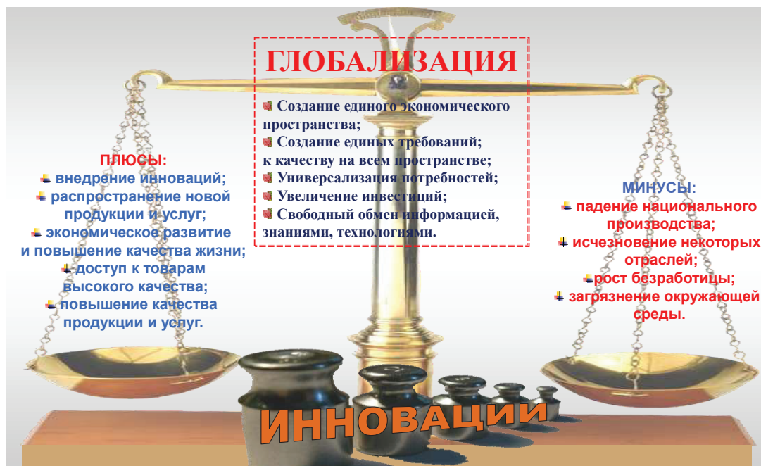
Рис. 1. Процесс глобализации

странства в единую зону, где могут свободно перемещаться информация, товары и услуги, капитал, идеи. Все это будет являться стимулом для развития современных институтов и отлаживания механизмов их взаимодействия.