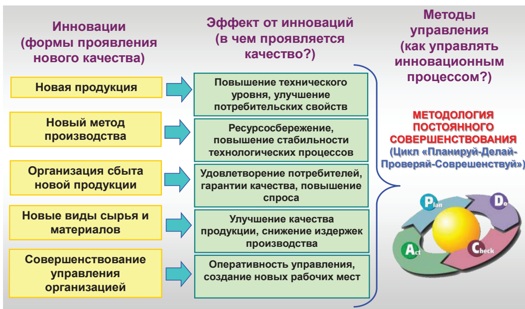
Рис. 3. Эффект от инноваций