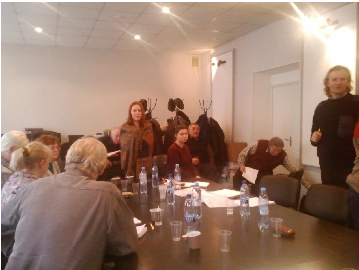
Сбор в малые группы для обсуждения проблем, связанные с сопровождением, и обобщения полученного материала